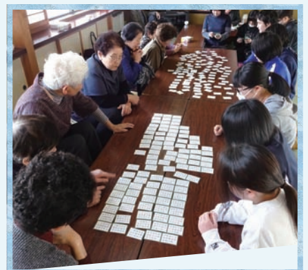
地域の方との交流