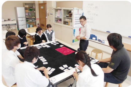
(外部講師によるレクリエーション講座)