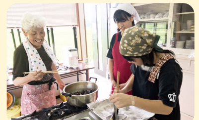
(地域の方との交流)