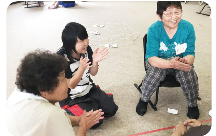
(ボランティア活動)